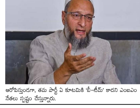
అలమట్టి ద్వారా, తమ పార్టీ పీ కూటమికి 'బీ-టీఎమ్' కాదని ఎంబిఎం నేతలు స్పష్టం చేస్తున్నారు.

పార్టీలతో మూడో ప్రంలే ఏర్పాటు విషయంపై చర్చిస్తున్నాం. మరొకప్పుడు రోజుల్లో దీనిపై పూర్తి స్పష్టత వస్తుంది" అని ఆయన వివరించారు. 2020 అసెంబ్లీ ఎన్నికల్లో ఎంబిఎం బదు స్థానాల్లో గెలిచి అందరినీ అభ్యుదయించింది. అయితే, ఆ తర్వాత నలుగురు ఎమ్మెల్యేలు ఆర్డీతో చేరడంతో ప్రస్తుతం అఖిలర్ ఇమాన్ మాత్రమే పార్టీ ఏకైక శాసనసభ్యుడిగా కొనసాగుతున్నారు. బీహార్లో 17 శాసానికీ పైగా ఉన్న ముస్లిం జనాభానే లక్ష్యంగా చేసుకుని ఎంబిఎం తమ వ్యూహాలకు పడుపెడుతోంది. ఇటీవల పార్టీ అధినేత అనంద్ దీప్ ఒవైసీ కూడా సీమాంచలం ప్రాంతంలో పర్యటించి పార్టీ క్రేజుల్లో ఉత్సాహం నింపారు. బీహార్లోని మొత్తం 243 అసెంబ్లీ స్థానాలకు నవంబర్ 6, 11 తేదీల్లో ఎన్నికలు జరగనుండగా, నవంబర్ 14న ఓట్ల లెక్కింపు చేపట్టనున్నారు. ఎంబిఎం పోటీతో సెక్యూలర్ ఓట్ల వీలి బీజేపీకి లాభం చేకూరుతుందని వివక్షాలు