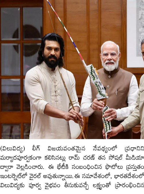
(విలువిద్య) బిగ్ విజయంపంతులైన నేపథ్యంలో ప్రధానిని మర్యాదపూర్వకంగా కలిసినట్లు రామ్ చరణ్ తన సోషల్ మీడియా ద్వారా వెల్లడించారు. ఈ భేటీకి సంబంధించిన ఫోటోలు ప్రస్తుతం ఇంటర్నెట్లో వైరల్ అవుతున్నాయి. ఈ సమావేశంలో, భారతదేశంలో విలువిద్యకు పూర్వ వైఖరం తీసుకువచ్చే లక్ష్యంతో ప్రారంభించిన